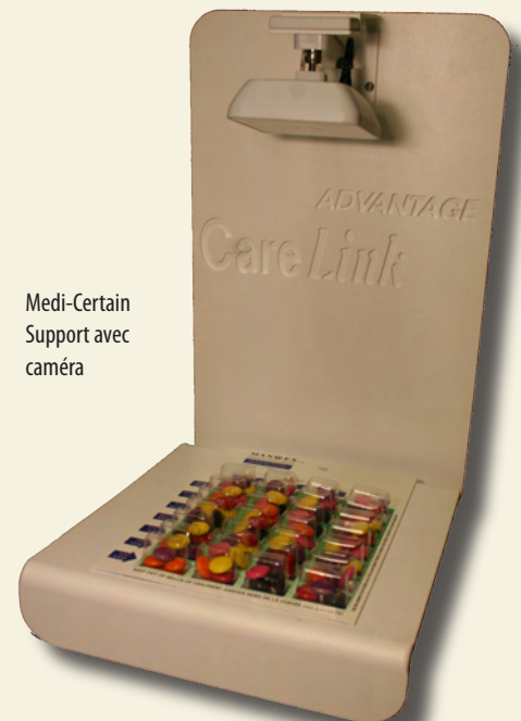
Medi-Certain Support avec caméra

Quand le client prend son étui à médicaments sur le support à cet effet, une vidéo est automatiquement enregistrée et envoyée aux soignants par courriel. Ils peuvent alors facilement vérifier quel médicament a été pris (lundi matin, mardi midi, samedi soir...). Le soignant n'intervient pas si c'est le bon médicament qui a été pris. Si, par contre, le client n'a pas pris le bon médicament, le soignant doit intervenir pour éviter que la personne prenne deux fois le même médicament par erreur.