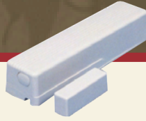
Contact de porte